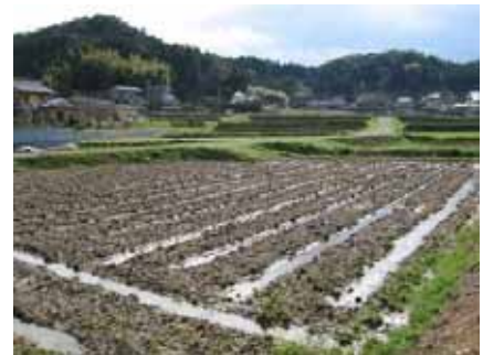
檜田地区の農地のある風景