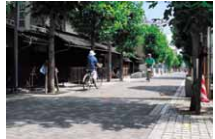
歴史の風情を残すまちなみ (城北町)

また、歴史的なまちなみ保全に向けた地域の価値観が市民に共有されず、歴史的景観に対するデザイン上の配慮を欠いた建築物や屋外広告物等、種々の阻害要素も見受けられます。