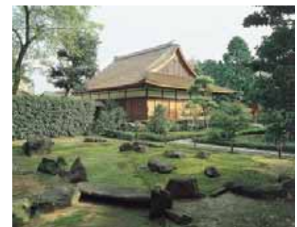
普門寺（重要文化財）