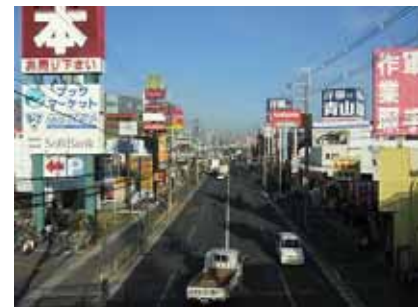
ロードサイド型店舗

加えて、施設規模を超えた巨大で様々な色彩の屋外広告物が雑然とした印象を与え、背後の山並みへの眺望を阻害している場所も見受けられます。