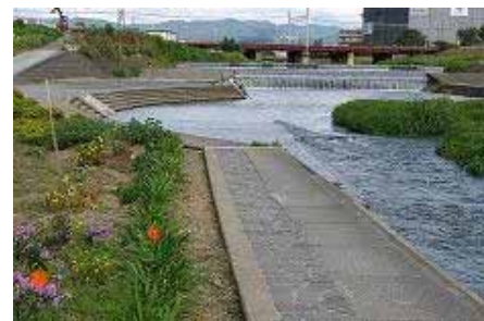
市民の憩いの場となる親水空間