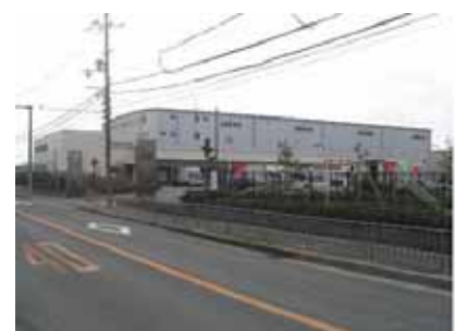
沿道の配送センター