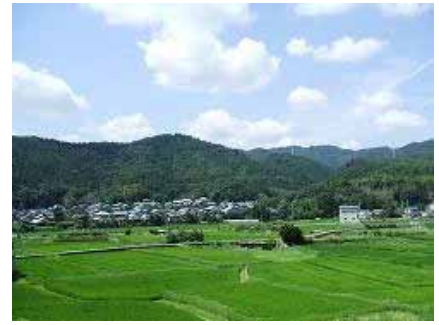
原地区の里山風景

しかし、農家人口は年々減少し、高齢化による担い手不足によって十分に管理されない農地や耕作放棄地が発生し、景観が損なわれている場所も見受けられます。また、背景の里山と調和しない建築物や工作物、屋外広告物も見受けられます。