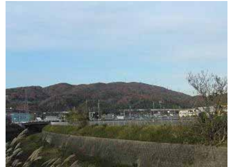
市街地から見える山並み

さらに、今後は新名神高速道路や（仮称）高槻東道路等大規模な公共施設の整備事業が予定されており、山並みの景観との調和が求められています。