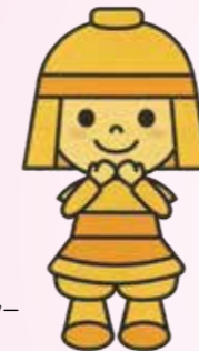
高槻市マスコットキャラクター はにたん