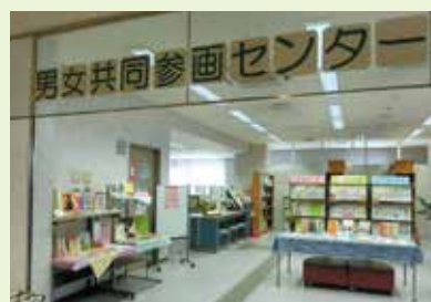
クロスパル高槻4階。 エレベーターを降りてすぐです。

個人や自主グループの活動の場として、気軽に利用できるオープンスペースを開放しています。予約も受け付けます。