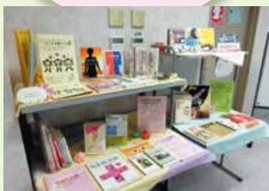
図書も充実しています。

男女共同参画に関する図書・ビデオ・DVDなどを貸出しています。 (貸出冊数：図書5冊まで、ビデオ・DVD2本まで 貸出期間：2週間まで)