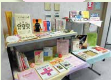
図書も充実しています。

男女共同参画に関する図書・ビデオ・DVDなどを貸出しています。 (貸出冊数：2冊(本)まで、貸出期間：2週間まで)