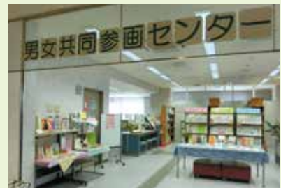
クロスパル高槻4階。 エレベーターを降りてすぐです。

男女共同参画を推進する団体・グループなどの活動を支援する利用者団体の登録を行っています。