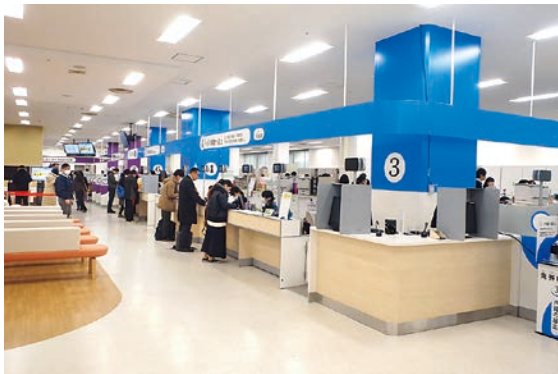
リニューアルを終えた市役所本館1階窓口