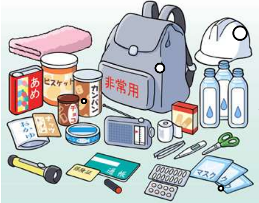
非常持出品の一例

建物が無事でも、水道が断水したり、建物の水道管や排水管が壊れると トイレが使えません