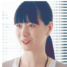
カツキ 結婚してから高槻市に住む。京都の大学で働く