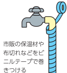
市販の保温材や布切れなどをビニルテープで巻きつける