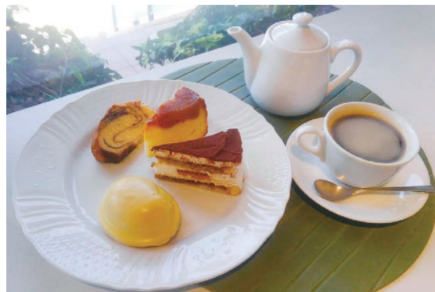
甘さ控えめの手作りのお菓子とスペシャルティコーヒー