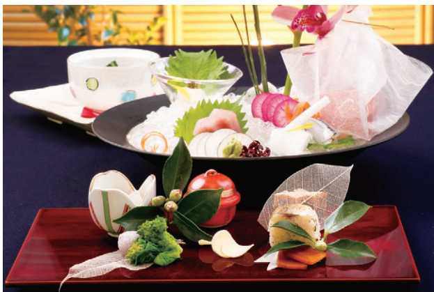
旬の食材を季節折々の彩りで仕上げた料理