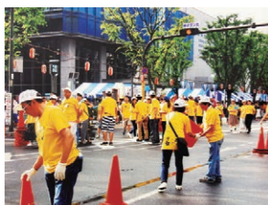
オリジナルTシャツがもらえる

簡単な手伝いのできる15歳以上の人を募集。希望者は当日14:15までに総合センター1階ボランティア受付へ。中学生不可。