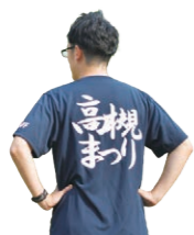
今年のTシャツはこれ