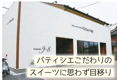
パティシエこだわりの スイーツに思わず目移り

看板商品のしあわせのプリン、キャラメルのみとまめらかな味わいのバランスがたまらない一品。