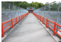
朱色の欄干が目を引く長い参道。