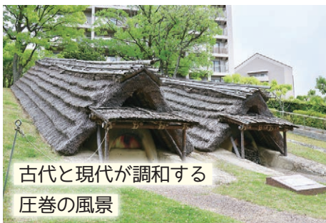
古代と現代が調和する 庄巻の風景