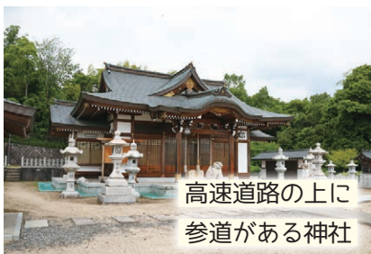
高速道路の上に 参道がある神社