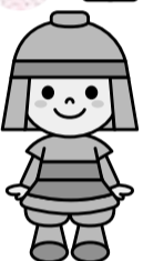
市マスコットキャラクター・はにたん