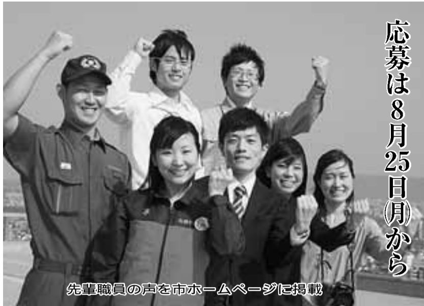
先輩職員の声在市ホームページに掲載