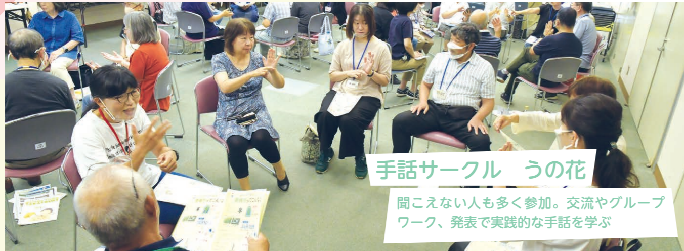
手話サークル うの花 聞こえない人も多く参加。交流やグループワーク、発表で実践的な手話を学ぶ