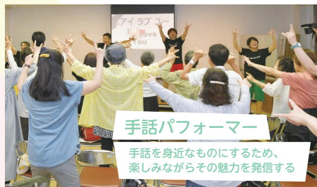
手話パフォーマー 手話を身近なものにするため、楽しみながらその魅力を発信する

手話を学ぶと、聞こえない人の普段の生活を知ることができ、新しい発見がたくさんあります。学んできた自分の手話が相手に伝わる瞬間が楽しいです。