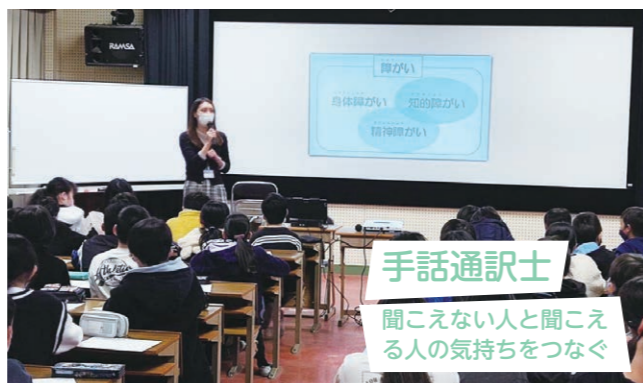
手話通訳士 聞こえない人と聞こえる人の気持ちをつなぐ