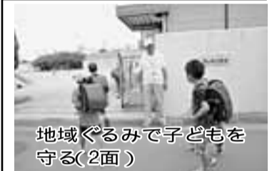
地域ぐるみで子どもを守る(2面)