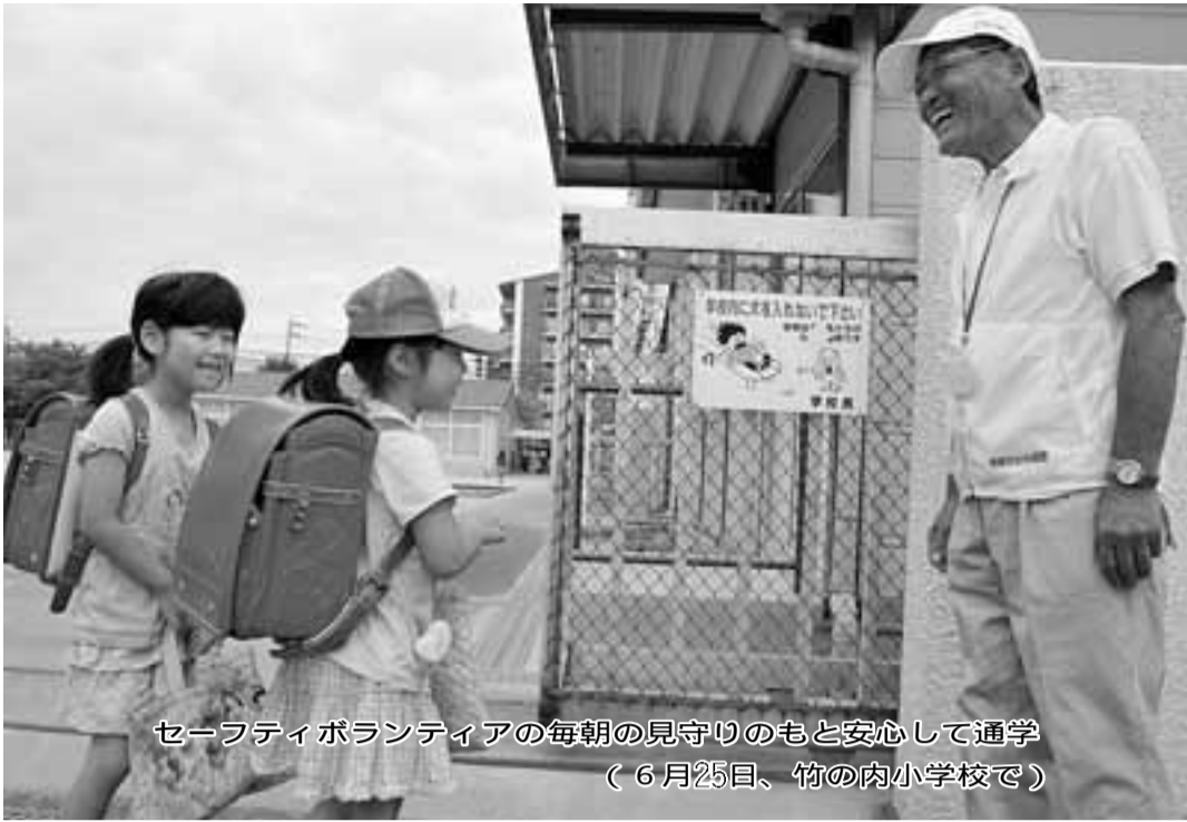
セーフティボランティアの毎朝の見守りのもと安心して通学(6月25日、竹の内小学校で)