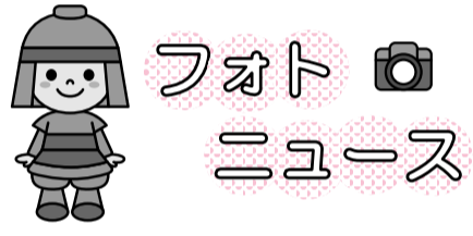
市マスコットキャラクター・はにたん