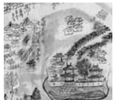
高槻城と西国街道を描いた絵図