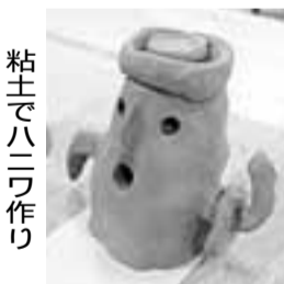
粘土でハニワ作り

8月20日はハニワの日です。今城塚古代歴史館では、ハニワにまつわる体験教室を開催します。会場はいずれも同館 ☎682・0820、先着各30人。