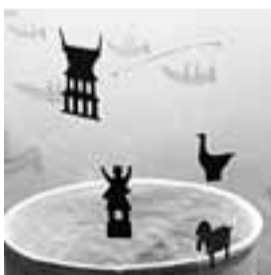
ハニワのモビール