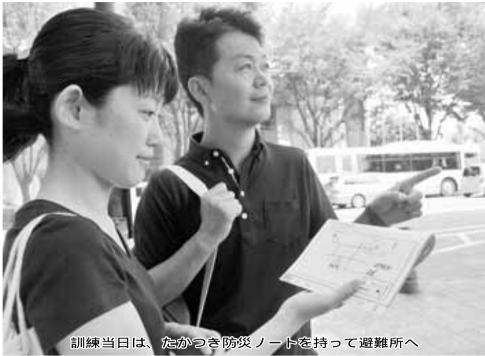
訓練当日は、たかつき防災ノートを持って避難所へ

市は8月25日(日)午前9時から正午まで、全市民を対象にした「市全域大防災訓練」を実施します。市民の皆さんは、全戸に配布している「たかつき防災ノート」を持って、避難所へ向かってください。