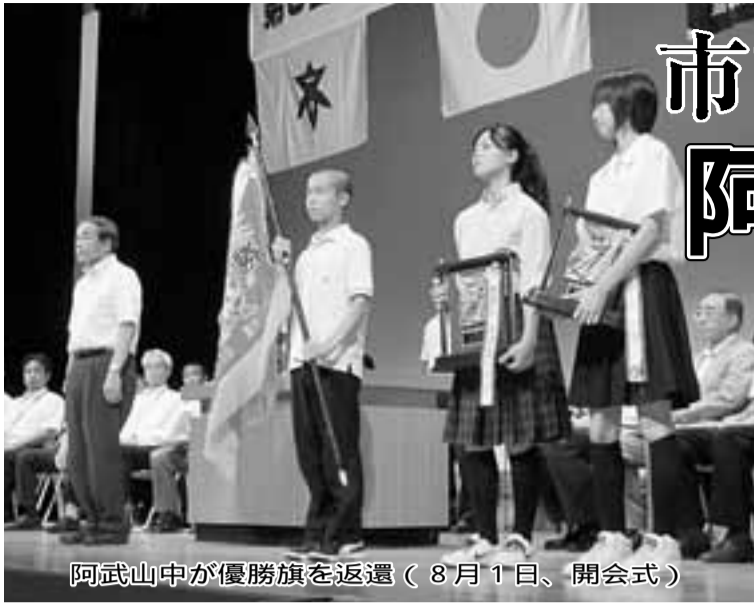
阿武山中が優勝旗を返還(8月1日、開会式)