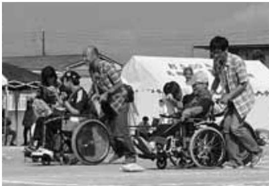
車いす・バギー競争

＜日時＞10月6日(日)午前10時～午後3時30分 無料。当日直接、会場へ ＜会場＞第一中学校運動場 ＜競技種目＞パン食い競争、綱引き、玉入れなど ＜問合せ＞同実行委員会(障がい福祉課内 ☎674・7164、Fax674・7188)