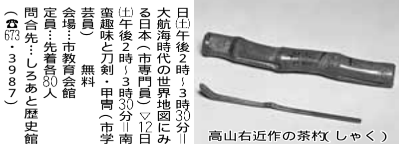
高山右近作の茶杓(しゃく)