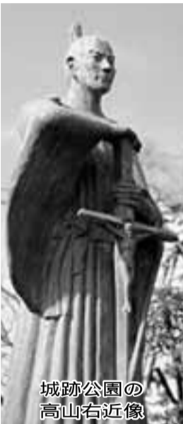
城跡公園の像 高山右近