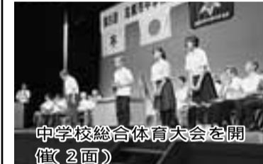
中学校総合体育大会を開催(2画)