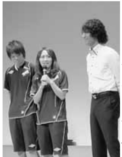
世界で活躍する選手からのエールは生徒たちの励みに