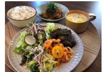
【魅力ある個店の出店促進・育成】