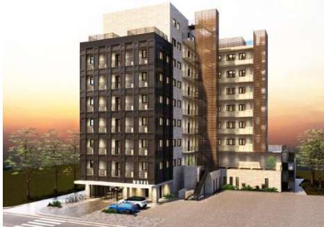
【市有地を活用したホテル誘致】