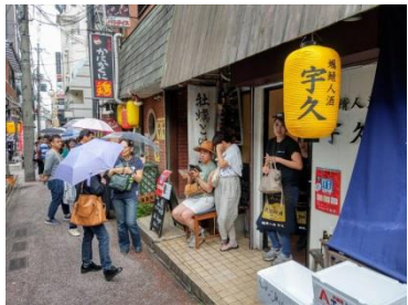
【商業の活性化に資するイベント開催】