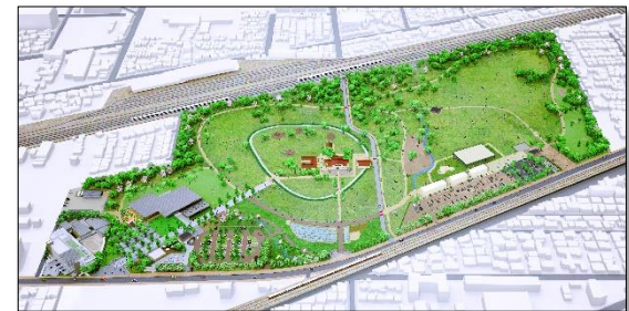
【安満遺跡公園の整備】