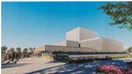
【高槻城公園芸術文化劇場の整備】