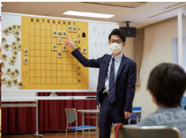
子ども将棋 高槻サテライト教室