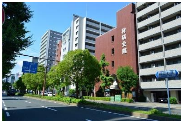
現関西将棋会館（大阪市福島区）