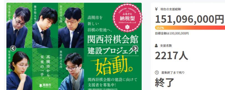
第1期のふるさと納税型クラウドファンディング