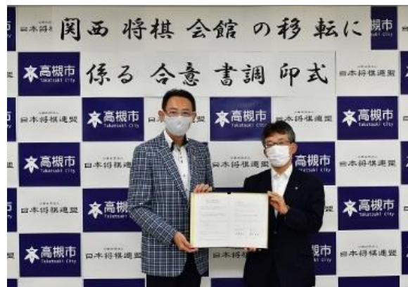
合意書調印式（令和3年7月27日）