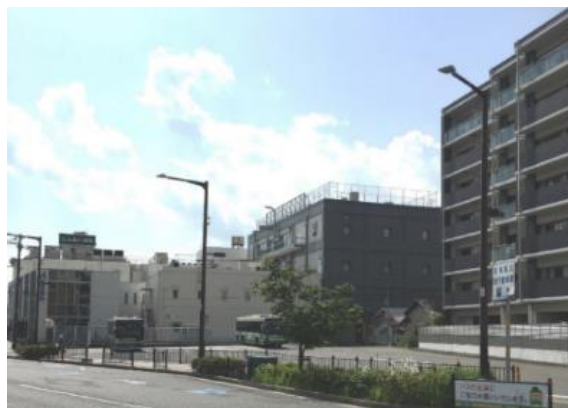
移転候補先のJR高槻西滞留所 (JR高槻駅西口徒歩0分)