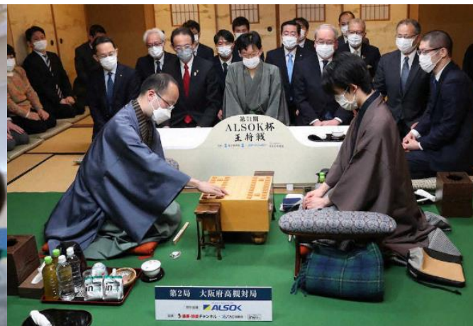
第71期 ALSOK杯王将戦第2局 令和4年1月22日、23日 開催 渡辺 明 王将 対 藤井 聡太 竜王