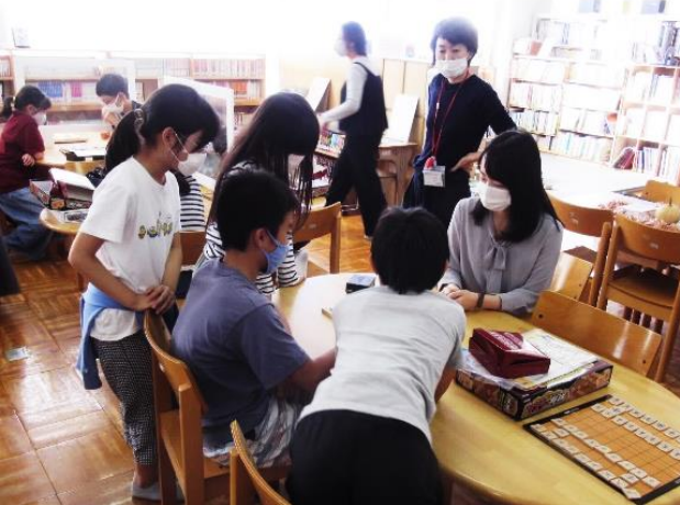
学校への棋士派遣事業

将棋を活用しつつ、日本将棋連盟との包括連携協定に基づき、将棋のまち高槻を推進します。加えて、関西将棋会館の高槻移転を契機に交流人口・関係人口の増加を目指します。