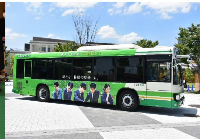
関西将棋会館高槻移転を祝した ラッピングバス「高槻将棋ライナー」