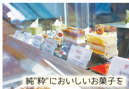
純粋に美味しいお菓子を