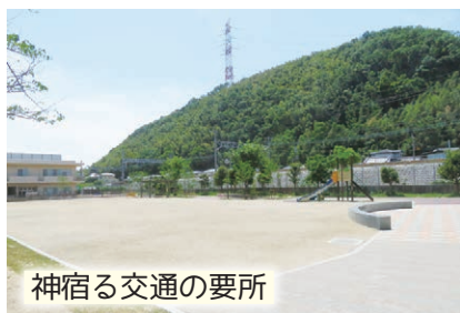
神宿る交通の要所

かなびとは「神の宿る所」という意味。この辺りにはかつて山陽道の駅家があったと推定され、西国へ赴く都人が家族と別れを惜しみ、和歌にも詠まれた。