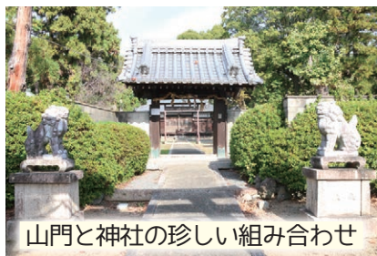
山門と神社の珍しい組み合わせ