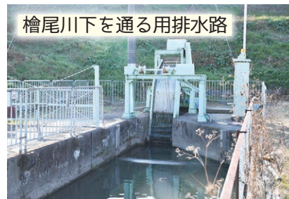
檜尾川下を通る用排水路

檜尾川の下を伏せ越す野田樋の前には、水路の流れを妨げるものを取り除くため、除塵（じょじん）機が設置されている。