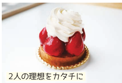
2人の理想をカタチに