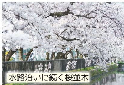
水路沿いに続く桜並木