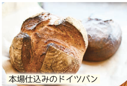
本場仕込みのドイツパン