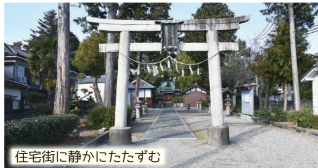
住宅街に静かにたたずむ