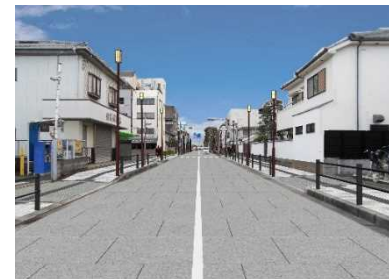
大手八幡線の整備(イメージ)

■ 高槻城公園へのアクセス道路を整備 (大手八幡線・野見八幡線の無電柱化・美装化を推進)