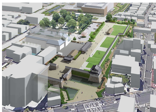
高槻城公園(北エリア)整備イメージ