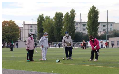
グラウンド・ゴルフ大会の様子