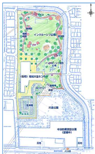
（仮称）地域共生ステーションの整備イメージ【一例】