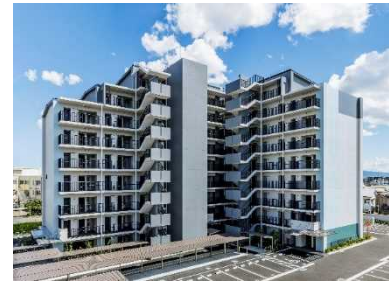
令和5年度に完成した富寿栄住宅1期住宅棟