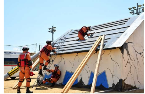
地域防災総合訓練の様子