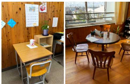
校内適応指導教室の様子