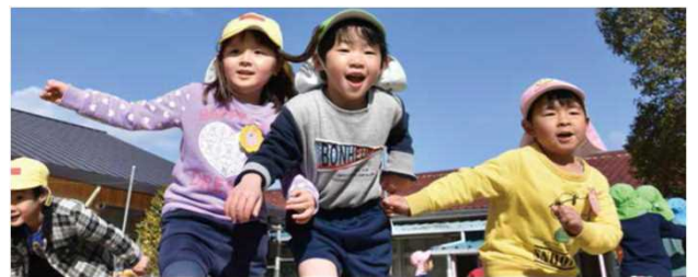
教育・保育の充実に向けた取組を推進