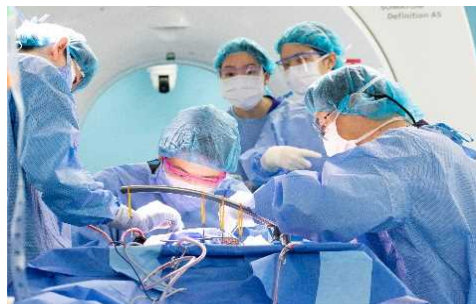
全国トップクラスの医療体制が整うまち