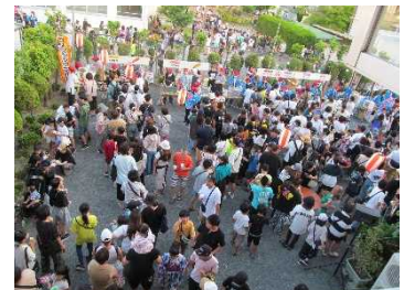
地区コミュニティの夏まつりの様子