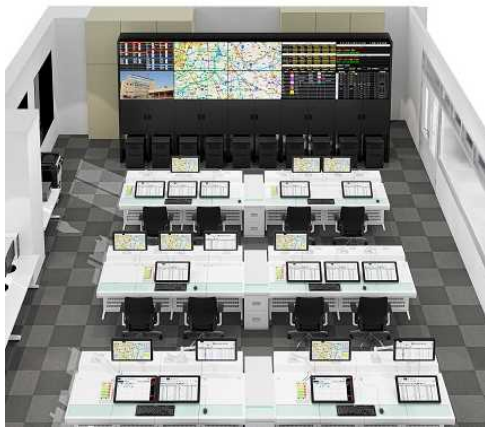
消防指令センター(イメージ) (令和7年度運用開始予定)