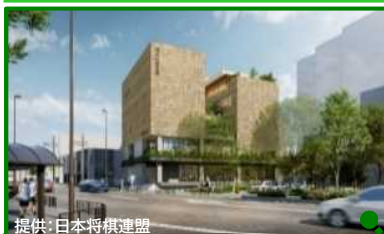
新関西将棋会館(令和6年秋)