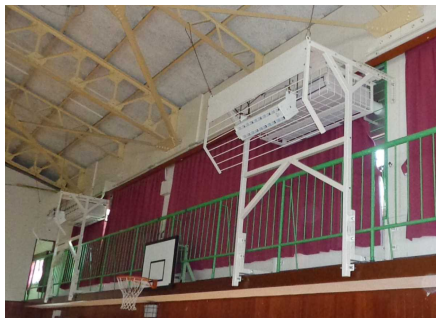
体育館に設置された空調設備