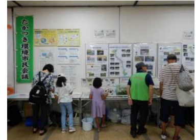
エコ&クリーンフェスタの様子