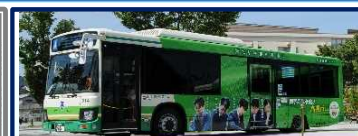
将棋ライナーの運行