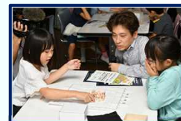
高槻産将棋駒の配布 / 棋士による出前授業