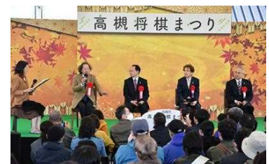
将棋まつりの様子