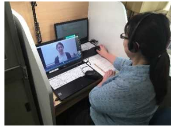
オンラインでの保育施設入所相談