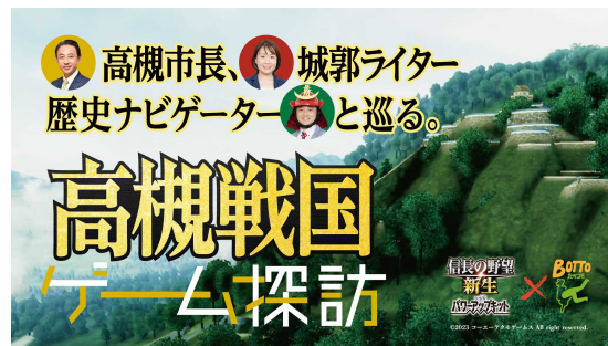
人気ゲームとのコラボで高槻の歴史を紹介