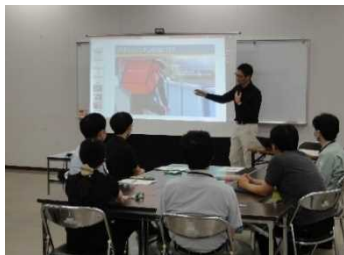
DXアドバイザーによる職員研修