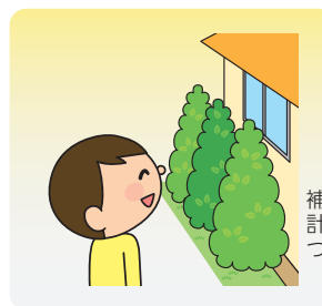
補助額は生け垣の延長で計算します。延長1mにつき最大5,000円

市のブロック塀撤去工事補助金の交付を受けた対象者が、新たに設置する生け垣にかかった工事費用の一部（上限10万円）を補助します。工事着手前に申し込みが必要。 申込 来年1/31(金)までに 窓 で