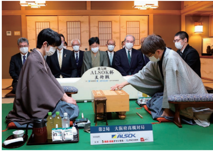
全国が注目するタイトル戦が高槻で。王将戦は、例年摂津峡 花の里温泉 山水館が会場