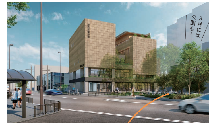
※パースはイメージ

関西将棋会館の移転にともない、高槻のまちでも将棋ムードが着々と高まり、目にする機会も増えているはず。「将棋のまち」ならではの最近の話題とともに、高槻と将棋の関係をおさらい。