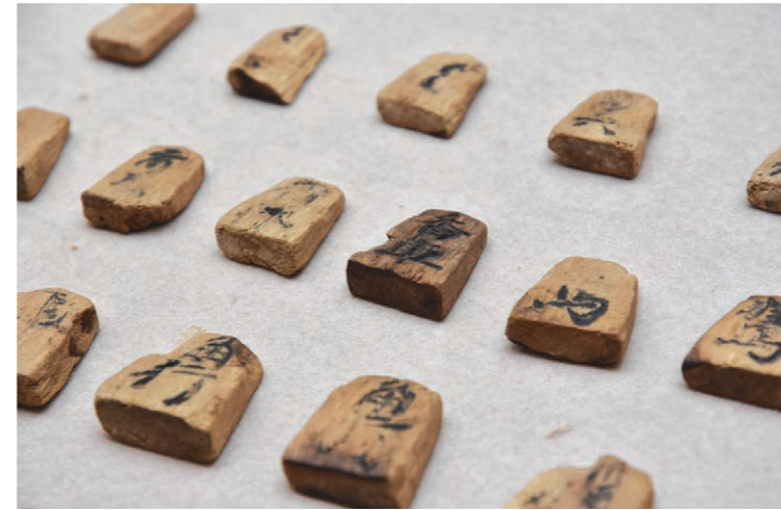
発掘された江戸時代の小將棋の駒(上)。市内の旧家で見つかった携帯サイズの将棋の入門書「象碁指方伝(しょうぎさしかたのでん)」と明治時代の将棋盤(下) ※いずれもしるあと歴史館で展示中