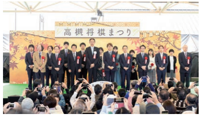
高槻将棋まつり(上)は安満遺跡公園で実施。この年は日本将棋連盟と共催で「全国将棋サミット」(右)も同時開催