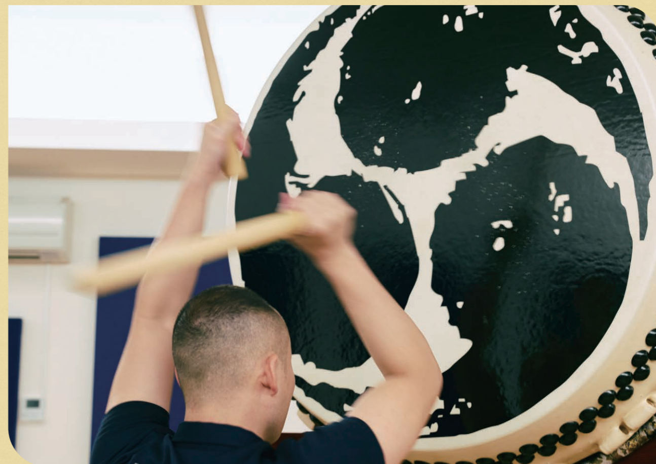
迫力ある大阪最大級の太太鼓。

[和太鼓政や]には、多くの太鼓が置かれています。太鼓の生産で有名な石川県白山市の会社と提携し、販売とメンテナンスもしています。