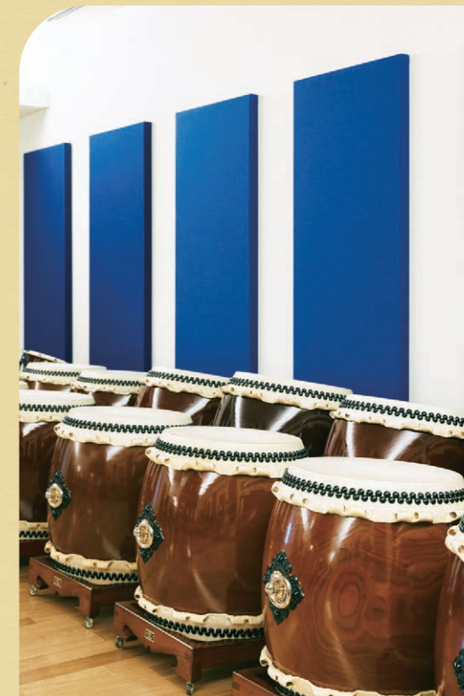
太鼓の販売とメンテナンスも。

「極力ムダな動きのないように背筋や足腰など全身を使って太鼓を叩きますが、やはり太いバチを握る手には、稽古と公演の証のマメができます」