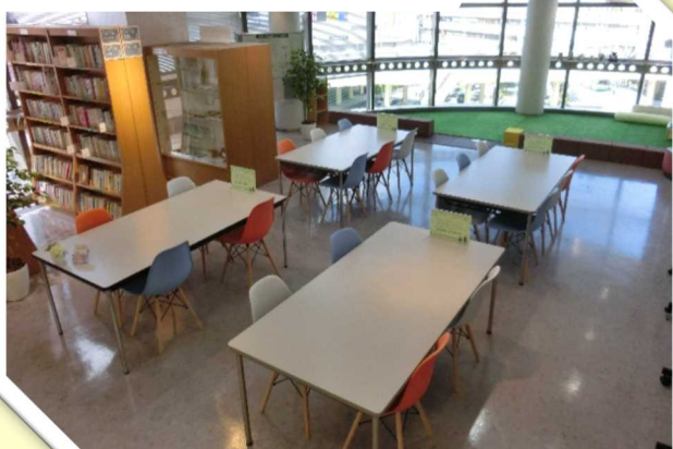
コミュニケーションコーナー