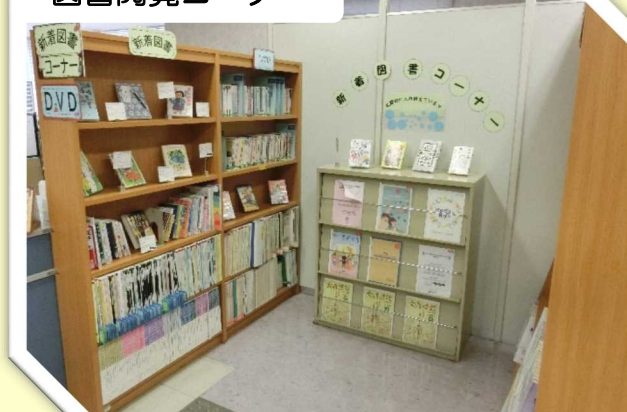
図書閲覧コーナー