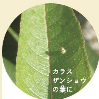
カラス ザンショウ の葉に