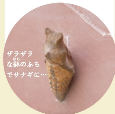
ザラザラ な鉢のふち でサナギに…

さあ、サナギになるぞ！ 幼虫はこのとき 自分が食べて育った 食草をはなれます。 木の幹や鉢や壁など しっかりした場所を 見つけます。ツルツルの 場所だと緑色、ザラザラ な場所だと茶色のサナギ になるんだって。