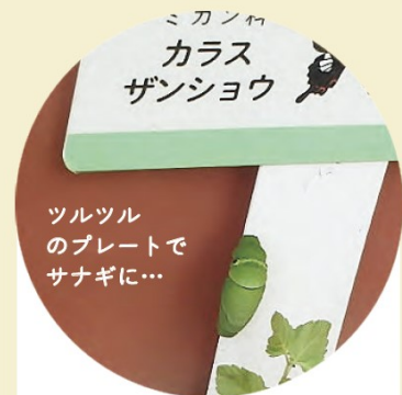
ミカンや カラス ザンショウ