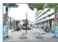
牧田ふれあいモール商店街