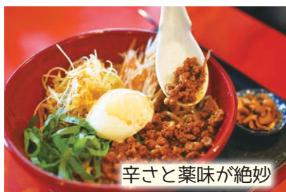
辛さと薬味が絶妙

味の決め手となる自家製の肉みそがたっぷり乗った、汁なし担々麺が一番人気。ラー油とさんしょうのピリッとした刺激と、大葉とミョウガの爽やかさが口いっぱいに広がり箸が止まらない。刺激を求めてリピーター続出。