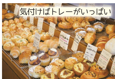
気付けばトレーがいっぱい