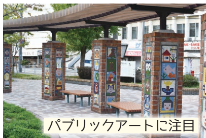
パブリックアートに注目

アートと豊かな緑が魅力的な団地。入り口にある「こどもギャラリー」は平成6（1994）年に団地の子どもたちが小さなタイルを張り合わせて作った絵を埋め込んだもの。敷地内にはウォーキングコースもある。