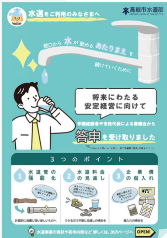
答申のポイントを中心に水道事業の現状・課題について