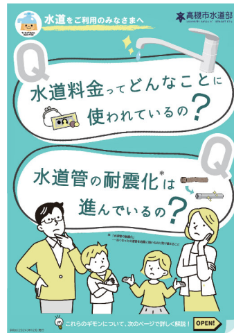
水道料金の使い道や管路耐震化の取組等について