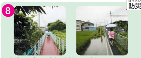
8 冬場に鉄板の通路が凍結して滑ることがある。(山手町1丁目、高垣町方面)