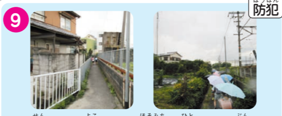
9 JR線のすぐ横にある細道。人ひとり分しか通れない箇所もある。交通の面は安全であるが、人通りが少ない。