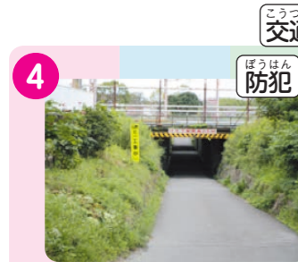
4 安満遺跡公園につながる、アンダーパス。非常に暗くて危ない。車からも自転車や歩行者は見えづらくなっている。