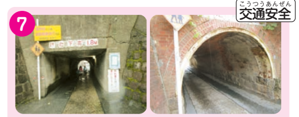
7 対面通行のトンネルになっている。車1台分の幅しかなく、車は対向車を気にしながらトンネルに進入する。車が通らない時を見計らい通行する必要がある。