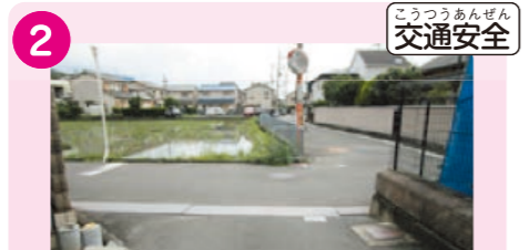
2 学校の東門 (ランドから出る門) を出てまっすぐ東に向かった先の交差点。車側からの死角となっている。