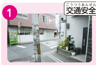
1 信号のない西国街道の交差点。(八丁畷町方面) 交通量が多く、危ない。