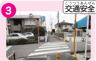
3 信号のない西国街道の交差点。(山手町1丁目、高垣町方面のJR線細道) 交通量が多い。