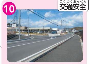
10 商業施設前のT字路が、車の交通量が多く横断に注意が必要。