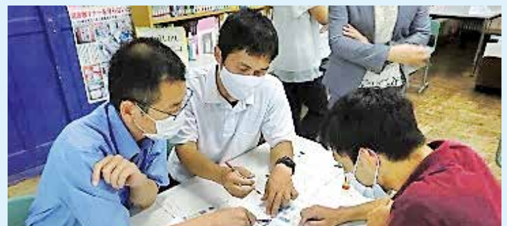
校内での教職員研修