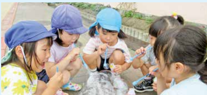
幼児教育等の充実