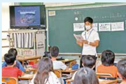
防災に関する授業