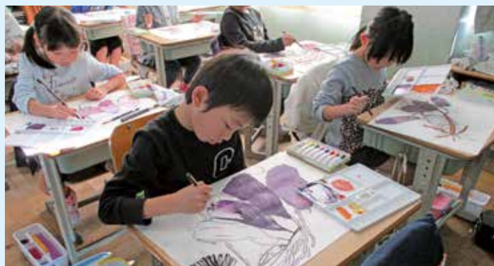
図画工作科の授業