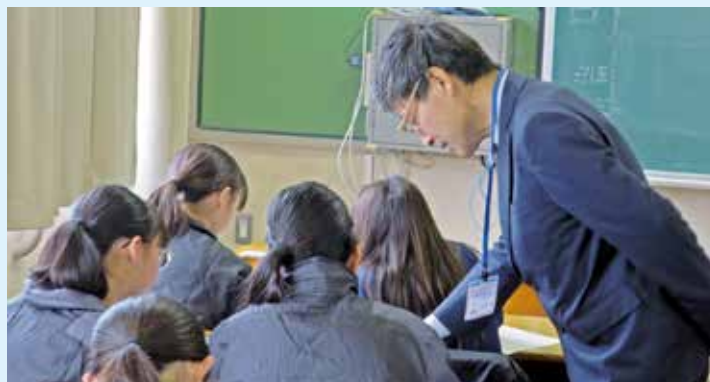
家庭学習支援事業「学び up ↑ 講座」