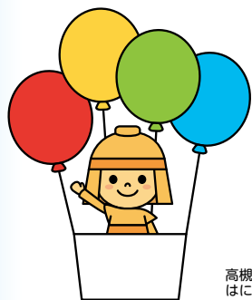
高槻市マスコットキャラクター はにたん

計画の進め方については、実施計画(教育努力目標)を立て、様々な取組を行い、その実施状況について点検・評価を行いながら、より良いものになるよう見直しを行う「PDCA サイクル」によって、総合的かつ計画的に取組を進めていきます。