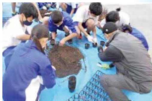
地域の方との協働

学校と地域をつなぐ仕組みや様々な教育資源の活用について、各校区の持ち味を生かしたよりよい関係を構築していくため、コミュニティ・スクールの導入を進めます。学校と地域が連携することにより、地域の教育力の一層の向上に努めます。