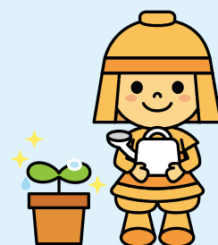
高槻市マスコットキャラクター はにたん