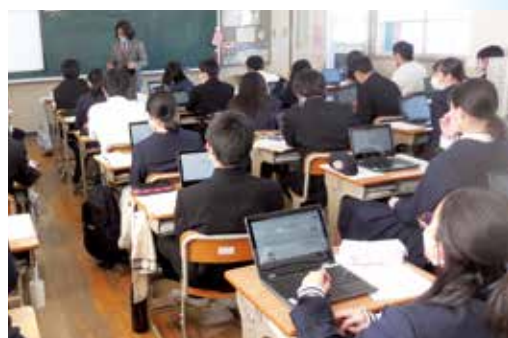
1人1台のタブレット端末を活用した授業

これからの時代に求められる、より質の高い教育を目指して、ICT機器を効果的に活用し、児童生徒が社会を生き抜く力を一層育む教育を推進します。