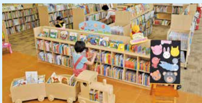
市立図書館(ミューズ子ども分室)