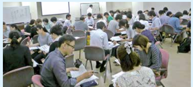
高槻市教育センターでの研修