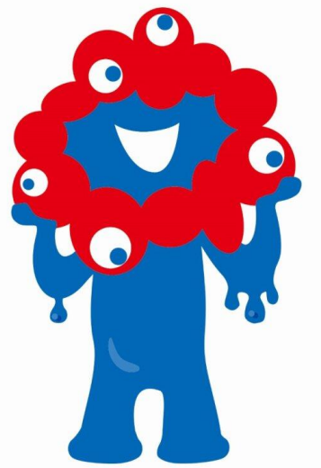
公式キャラクター ミヤクミヤク