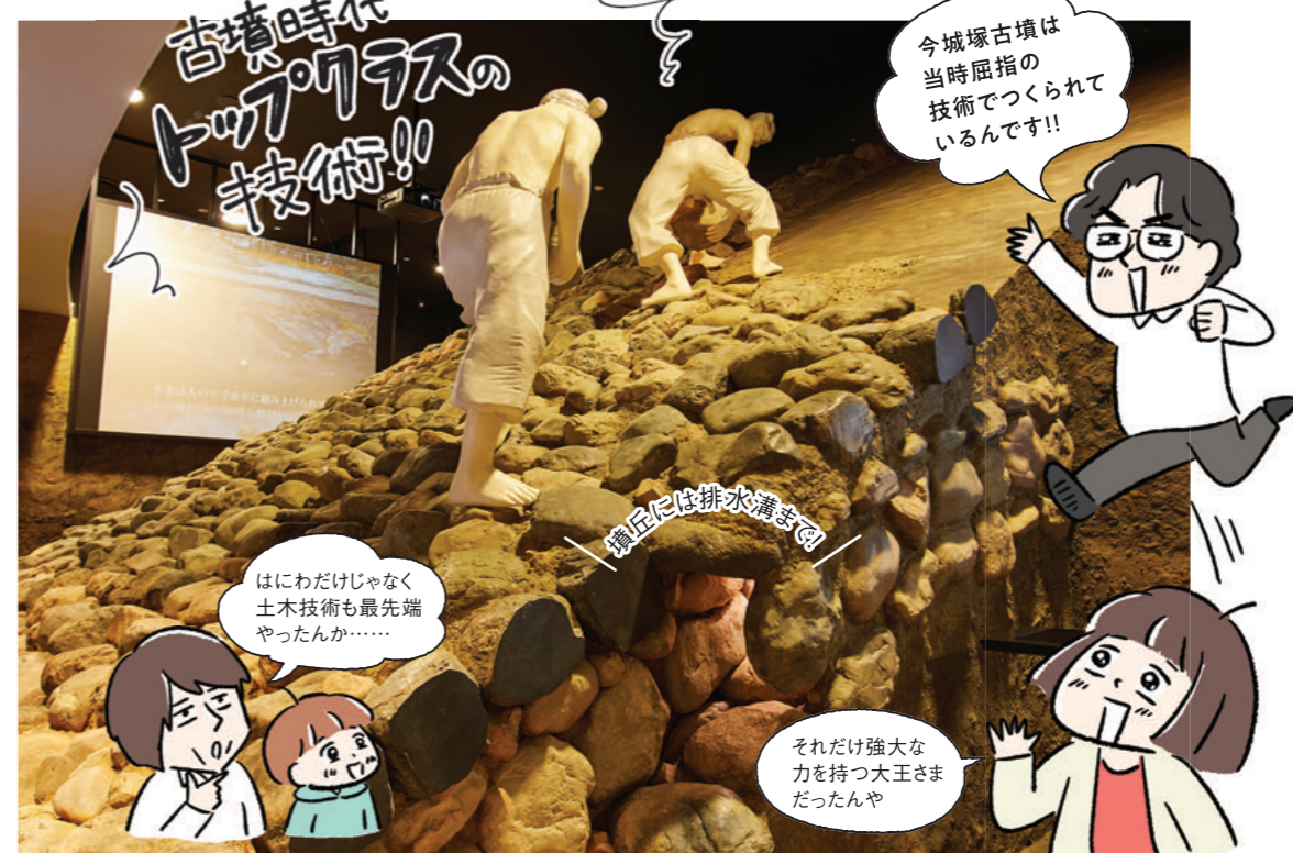
国家最大のプロジェクトだった古墳づくりの様子を実物大で再現した迫力のジオラマ。古墳ビルダーは頭上のはるか上! 土地の測量から土の積み上げ方まで、古墳の作りかたを解説する映像も必見