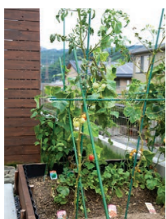
スペースがあれば、家にミニ畑を作るのもアリ

元気がないときのアドバイス 細菌の病気なら薬剤を散布するしかない。早めに対策すれば、量も回数も少なくて済む。もともと苗に菌がついていた場合は除去。苗でも初期の段階なら、間引いた部分に混んでいるところの苗を植え替えるのもあり。