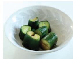
たくさん採れたら常備菜に上/トマトソース(左)、しその葉のしょうゆ漬け 下/きゅうりの浅漬け