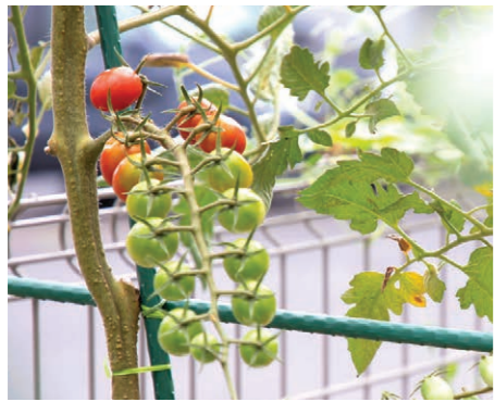
植物はうそをつかない。愛情を込めれば込めた分だけ応えてくれるのが、野菜づくりの楽しいところ