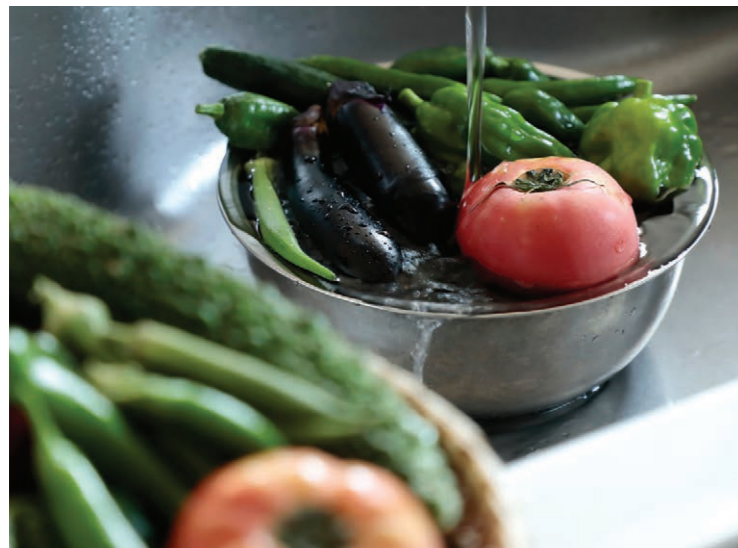
収穫したらすぐ調理できるのも家庭菜園の醍醐味。新鮮な野菜はみずみずしくて、料理をワンランクアップさせてくれる気がする