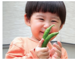
野菜づくりは食育にも。食べものを見る目が変わるはず