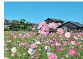
コスモスロード 一面に広がるコスモスはまさにインスタ映え。10/1~31。詳細は22ページを。 📍 西面口もしくは三島江南口

秋の体験交流型観光プログラム 「オープンたかつき2023秋」は、人気店のランチ、タルトや雑貨などさまざまな手づくりワークショップ、「ネオクラシックカーフェスティバル」など充実のラインナップ。予約はウェブで。