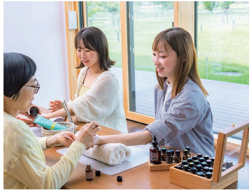
安満遺跡公園 ポーネルンド Park Center 事務室や貸室がある施設。oluoluマルシェなどナチュラルな暮らしのワークショップやヨガ教室など多様なイベントを実施している 📍 安満遺跡公園