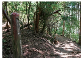
ボンボン山 標高も低く、ハイキングにおすす。晴れた日は大阪湾、生駒山まで見渡せる。 📍 神峰山口