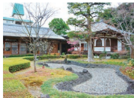
普門寺 枯山水庭園 こけらぎ 柿葺きの屋根の重要文化財の本堂の奥にある江戸初期の美しい庭園。拝観は予約制。 📍 富田支所