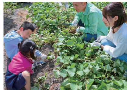
さつまいも掘り 📍 004149 無農薬、馬糞堆肥栽培の中田農園を含め、9月下旬から10月に市内各地の農園で実施 📍 原立石など